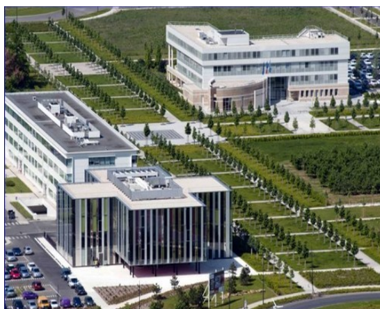
Immeubles de bureaux au Carré

Le développement du Carré se poursuit avec l'installation prochaine du Centre de gestion de la fonction publique territoriale de Seine-et-Marne et la construction d'un Théâtre qui accueillera ses premières représentations en 2014.